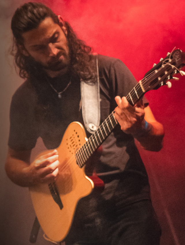
ALEX CHAMP - OPAL OCEAN

Nous avons repris tout ce qui faisait de la Multiac une guitare unique et y avons incorporé un nouveau préampli LR Baggs spécialement conçu selon nos spécifications. Ce système innovant possède aussi deux sources sonores pouvant être associées : les six capteurs individuels HEX et le micro Lyric.