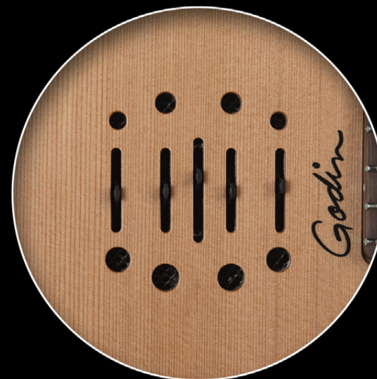
ENCORE / MUNDIAL