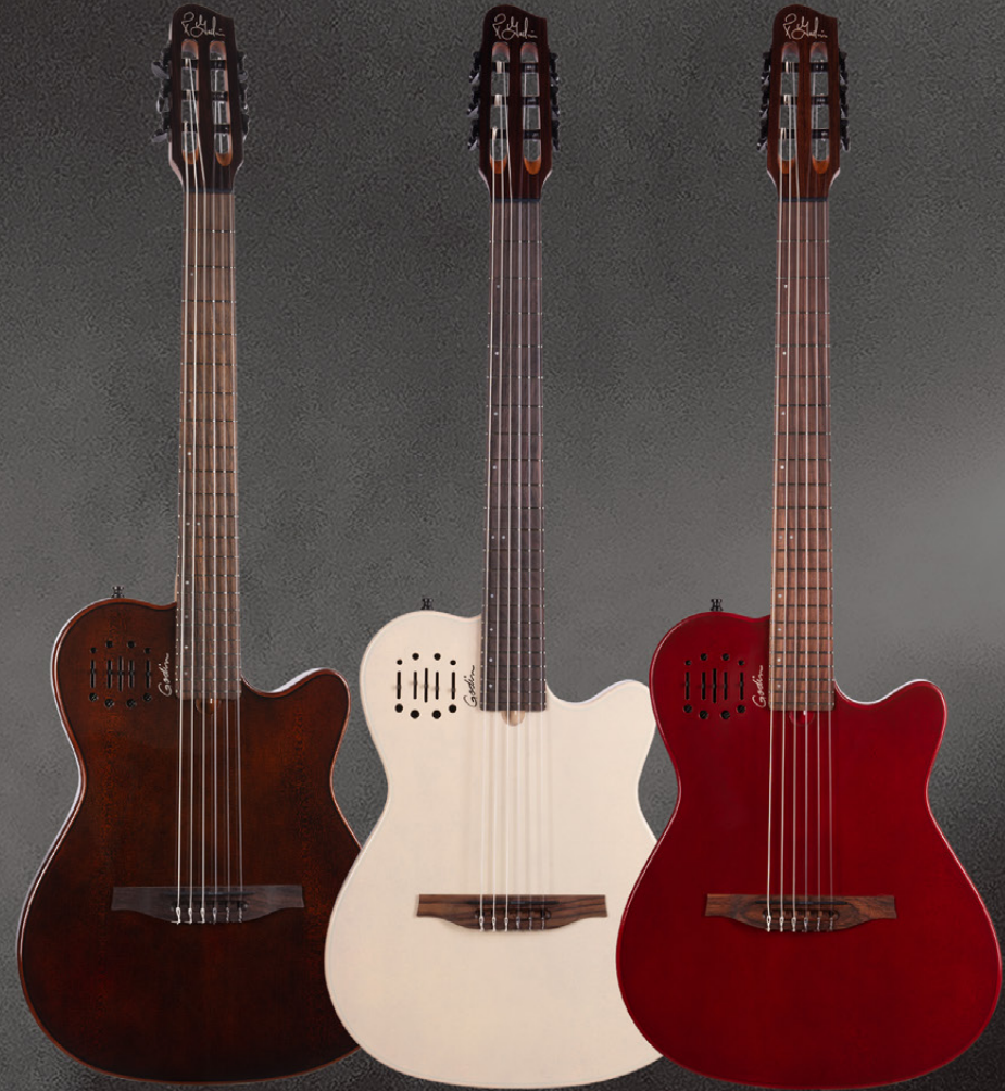
Kanyon Burst SKU: 052417 Ozark Cream SKU: 052400 Aztek Red SKU: 052394

La Multiac Mundial est l'un de nos modèles récents les plus populaires. Avec sa déclinaison moderne et stylisée, cette guitare à cordes nylon est le fruit de plusieurs années de recherche et développement. Si vous êtes à la recherche d'un instrument sobre et sans fioriture offrant un son de corde nylon amplifié naturel, et bien ne cherchez plus !